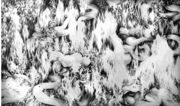
Julia Steiner, Flora im Schlaf (Gravitation) , 2009