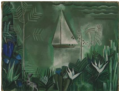
Otto Morach, Der Garten am Comersee, um 1922, Depositum Förderverein Kunstmuseum Thun

„Ich schätze das Bild, weil es ein wichtiges Werk eines bedeutenden Schweizer Künstlers ist, das die drei anderen Morach-Gemälde in der Sammlung gut und schön ergänzt.“