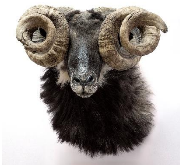
#7 Sophie Calle Infarctus silencieux , 2017 (série des Histoires vraies ) © Sophie Calle / ADAGP, Paris 2019 Courtesy the Artist & Perrotin