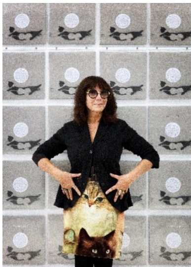
#6 Portrait de Sophie Calle