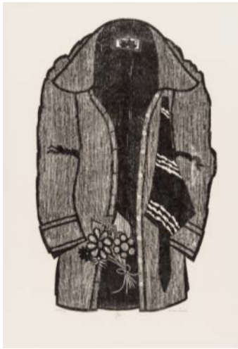
Ernst Ramseier, Hemd IX, o.D. Sammlung KMT